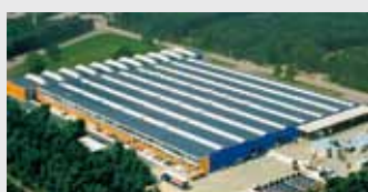
Hörmann Genk NV, Belgie