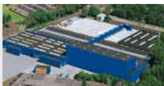
Hörmann KG Amshausen, Německo