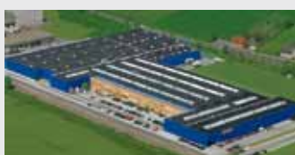
Hörmann KG Werne, Německo