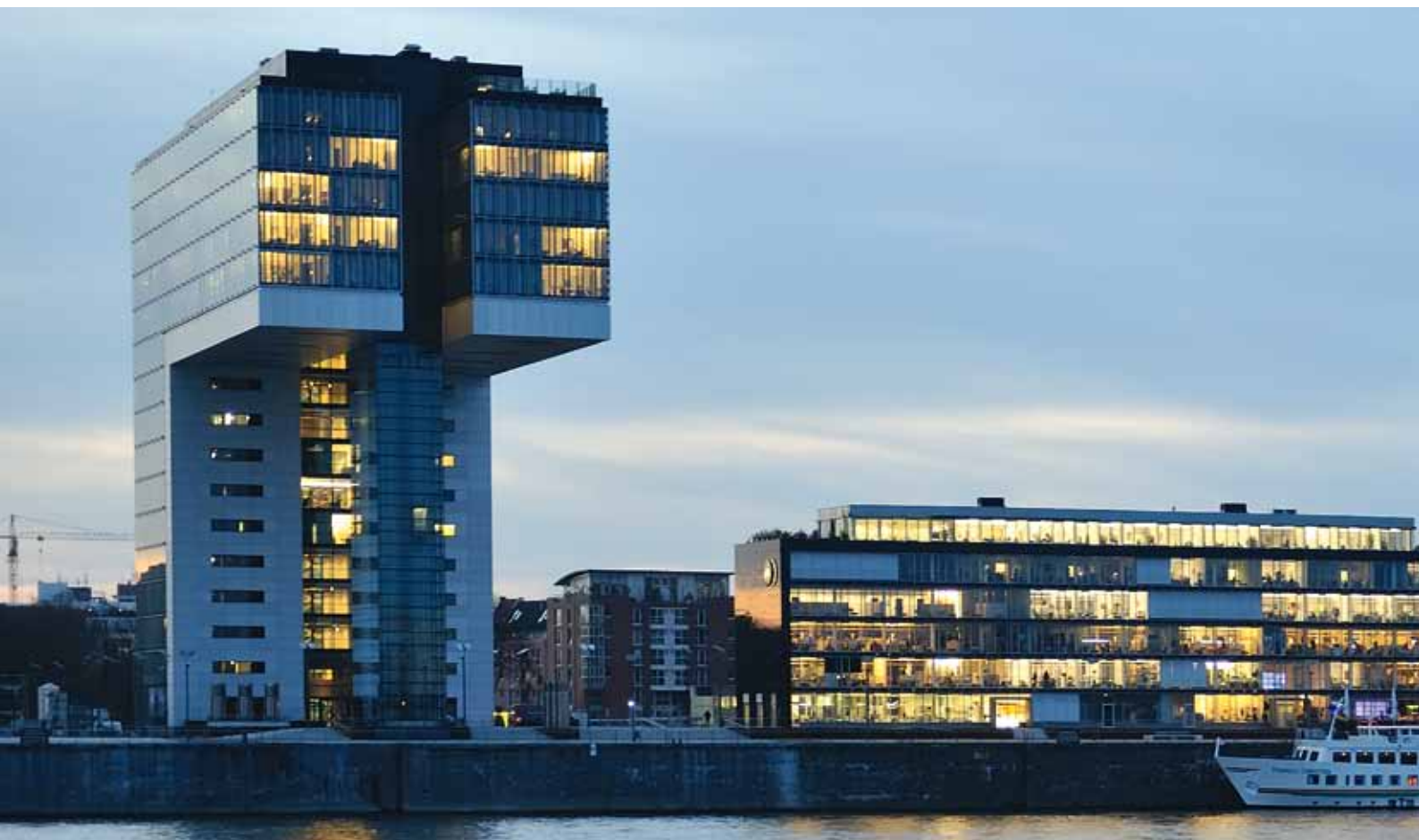
Jeřábové domy Rheinauhafen v Kolíně nad Rýnem, Německo s výrobky firmy Hörmann