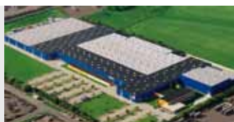
Hörmann KG Brandis, Německo