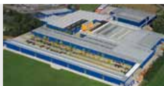
Hörmann KG Brockhagen, Německo