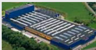
Hörmann KG Freisen, Německo