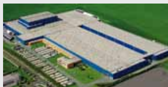
Hörmann KG Ichtshausen, Německo