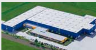
Hörmann KG Dissen, Německo