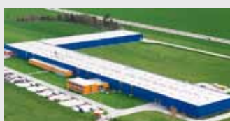
Hörmann Legnica Sp. z o.o., Polsko